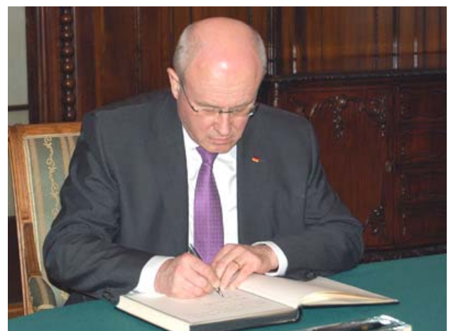
Der Fraktionsvorsitzende trug sich in das Kondolenzbuch in der polnischen Botschaft in Berlin ein

Hören Sie Volker Kauder dazu auch in seinem Podcast ( http://ikauder.de ).