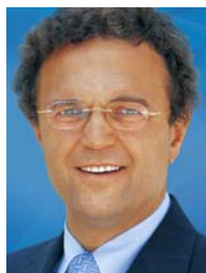
Hans-Peter Friedrich Vorsitzender der CSU- Landesgruppe Erster Stellvertretender Vorsitzender der CDU/CSU- Bundestagsfraktion

In ihrer Regierungserklärung vor dem Deutschen Bundestag hat Bundeskanzlerin Angela Merkel am Donnerstag den Bundeswehr-Einsatz in Afghanistan als notwendig im Kampf gegen den internationalen Terrorismus bezeichnet. „Es wäre ein Trugschluss zu glauben, Deutschland wäre nicht im Visier des internationalen Terrorismus“, sagte die Bundeskanzlerin.