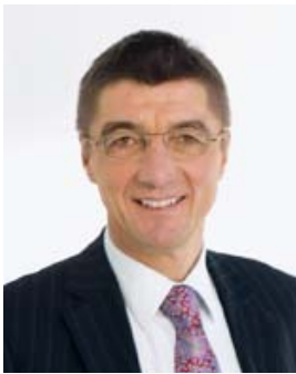
Andreas Schockenhoff Stellvertretender Fraktionsvorsitzender

Der Bundestag hat in dieser Woche zum ersten Mal in seiner Geschichte eine Stellungnahme abgegeben, ob mit einem Land Beitrittsverhandlungen zur Europäischen Union aufgenommen werden sollen. Dieses neue Recht hat der Bundestag mit dem Inkrafttreten des Lissaboner Vertrages im Dezember 2009 erhalten. Seither ist die Bundesregierung verpflichtet, Einvernehmen mit dem Parlament herzustellen, bevor sie im Europäischen Rat der Aufnahme von Beitrittsverhandlungen zustimmen kann. Bei allen vorhergehenden