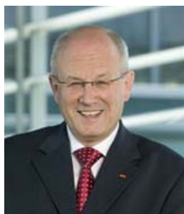
Volker Kauder Vorsitzender der CDU/CSU- Bundestagsfraktion