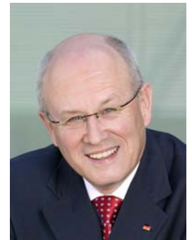
Volker Kauder Vorsitzender der CDU/CSU- Bundestagsfraktion

Dazu gehört auch, dass wir für Jugendliche aus Hartz-IV-Familien die Aufnahme von Ferienjobs attraktiver machen. Ich habe mich schon lange dafür ausgesprochen, dass ihr Verdienst nicht von vornherein mit den Bezügen der Eltern verrechnet werden darf. Nun wird ein Betrag von 1.200 Euro freigestellt. Den Kindern und Jugendlichen wird damit gezeigt: Leistung lohnt sich. Wenn ich unabhängig vom Staat bin, kann ich etwas erreichen.