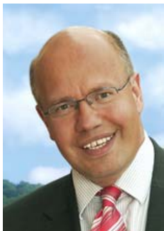
Peter Altmaier Erster Parlamentarischer Geschäftsführer