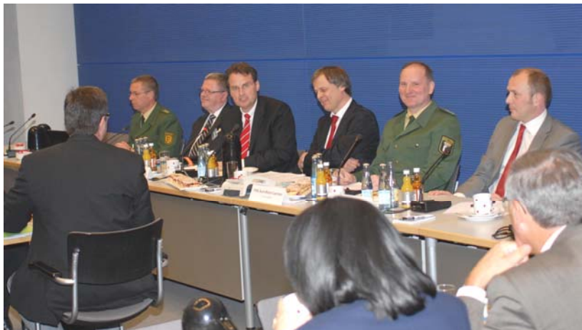
Der Stellvertretende Fraktionsvorsitzende Günter Krings und die Referenten des Expertengesprächs

Einig waren sich alle Teilnehmer des Expertengesprächs: Diejenigen, die ihre Gesundheit und ihr Leben für unseren Rechtsstaat riskieren, müssen besser geschützt werden. CDU und CSU werden darauf drängen, die immer brutaler werdenden Gewalttäter, die unsere Polizisten angreifen, auch härter zu bestrafen.