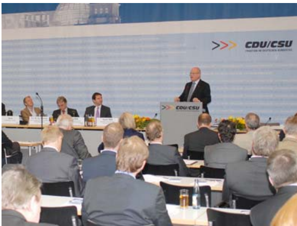
Fraktionsvorsitzender Volker Kauder beim Fachgespräch

Die Unionsfraktion bringt die Elektromobilität mit Nachdruck und großer Umsicht voran. Dies bewies sie nicht zuletzt in dieser Woche in ihrem Fachgespräch „Energisch elektrisch! Mit Hochdruck zum Stromauto“, auf dem sie zur Vorbereitung auf den Gipfel im Bundeskanzleramt am 3. Mai ihre neu entwickelten Leitvorstellungen zur Elektromobilität vor beinahe 300 geladenen Gästen spiegelte.